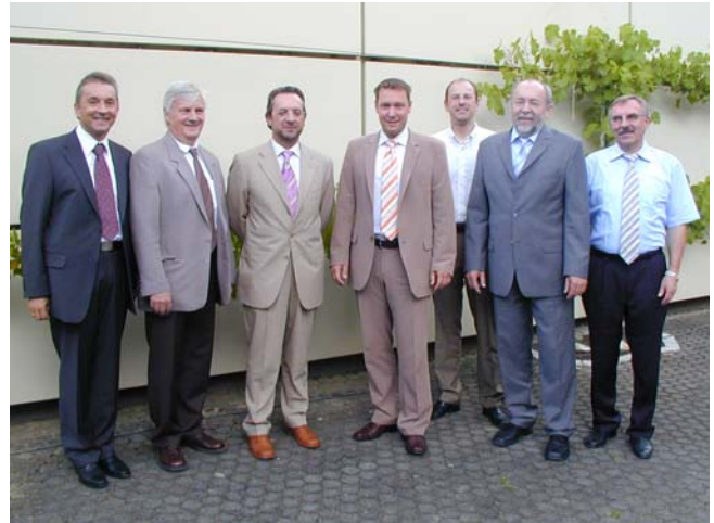
Gruppenbild des Vorstandes mit Landrat Armin Kroder und Bürgermeister Benedikt Bisping während des Brunnenfestes 2008.

Der Verein hat jetzt über 120 Mitglieder. Diesen bietet das jährlich stattfindende Brunnenfest eine gute Gelegenheit zur freundschaftlichen Kommunikation. Namensgeber für die Veranstaltung ist der große Springbrunnen auf dem Gelände der BSNL, der vor einigen Jahren von Schülern der Baufachklassen errichtet wurde. Unterstützt wird das Fest Jahr für Jahr durch die Berufsfachschule für gastgewerbliche Berufe . Die Schüler sorgen jedes mal für einen hervorragenden Service während der Veranstaltung.